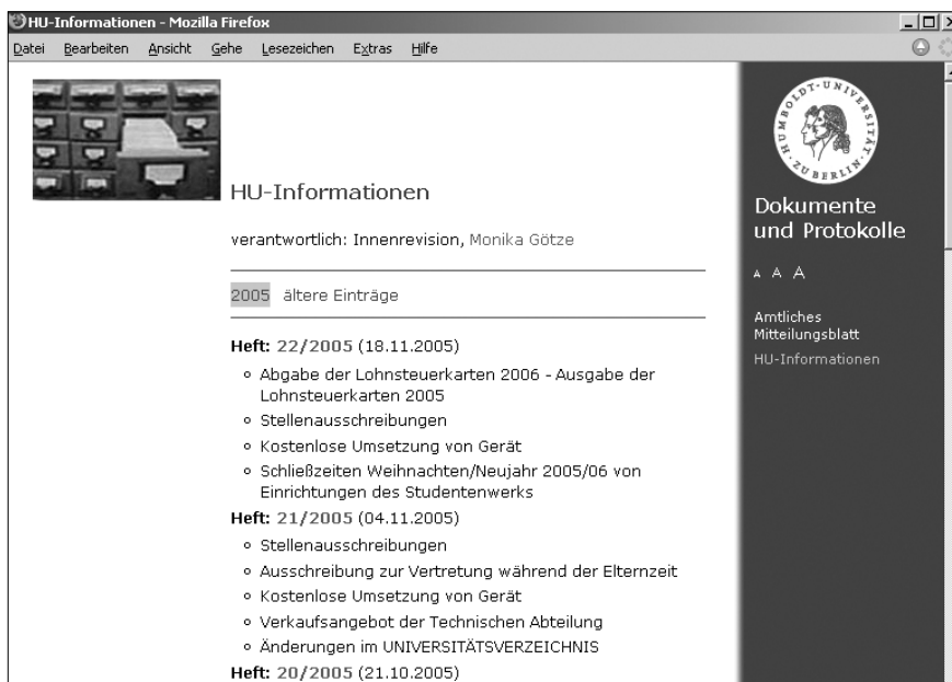
Abb. 2: »HU-Informationen im Web«