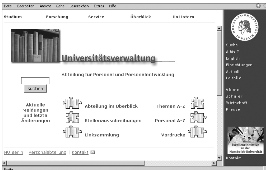
Abb. 1: »Die Homepage der Personalabteilung«

wieder statt, nachdem sie lange wegen Besuchermangels ausgefallen sind. Die Verordnung zur Schaffung barrierefreier Webseiten (BITV) hat die Einstellung zur Technologie verändert – obgleich sie für Berliner Hochschulen noch nicht einmal bindend ist.