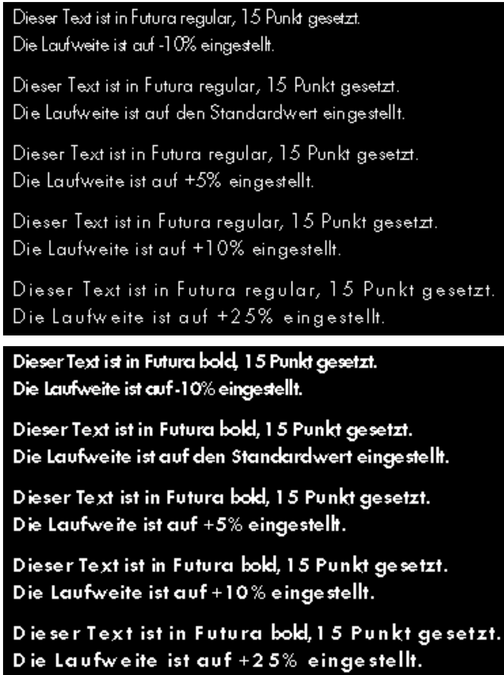
Abb. 6: Unterschiedliche Buchstabenabstände.