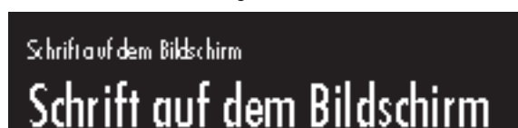
Futura 12 Punkt und 26 Punkt, regular, condensed.