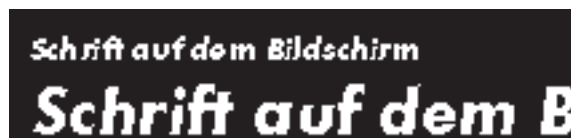
Futura 12 Punkt und 26 Punkt, heavy, oblique.