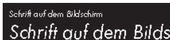
Futura 12 Punkt und 26 Punkt, regular, oblique.

Eine Antiquaschrift sollte auf dem Bildschirm nicht für längere Texte und nicht in kleinen Schriftgraden verwendet werden. Will man unbedingt Antiquaschriften auf dem Bildschirm verwenden, ist bei der Auswahl zu berücksichtigen, daß die Serifen und Strichstärken nicht zu dünn sind.