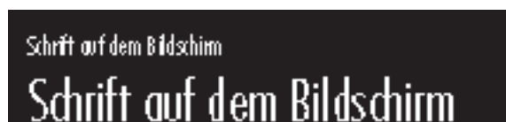
Futura 12 Punkt und 26 Punkt, light, condensed.