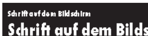
Futura 12 Punkt und 26 Punkt, heavy, condensed.