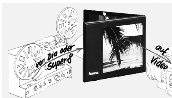
Abb. 3: Projektion über Umlenkspiegel

und mildert durch ihre Beschaffenheit etwas den Hot-Spot, also eine zu stark ausgeleuchtete Bildmitte. Hierbei handelt es sich um eine unangenehme Eigenschaft aller Filmprojektoren, die aber im Filmtheater durch die große Entfernung zwischen Projektor und Leinwand nicht auffällt.