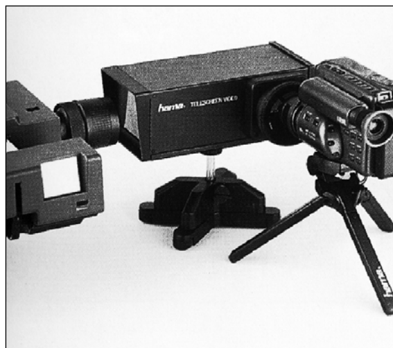
Abb. 5: Filmtransfer über Telescreen

hier fest vorgegeben und es streut so gut wie kein Fremdlicht ein, man muss also nicht völlig abdunkeln (s. Abb. 5).