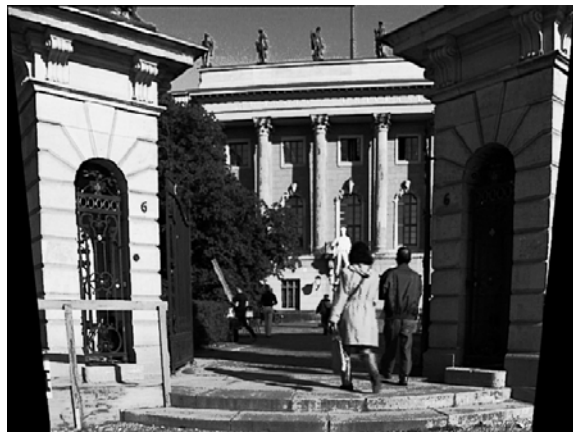
Abb. 2: Trapezverzerrung

und mildert durch ihre Beschaffenheit etwas den Hot-Spot, also eine zu stark ausgeleuchtete Bildmitte. Hierbei handelt es sich um eine unangenehme Eigenschaft aller Filmprojektoren, die aber im Filmtheater durch die große Entfernung zwischen Projektor und Leinwand nicht auffällt.