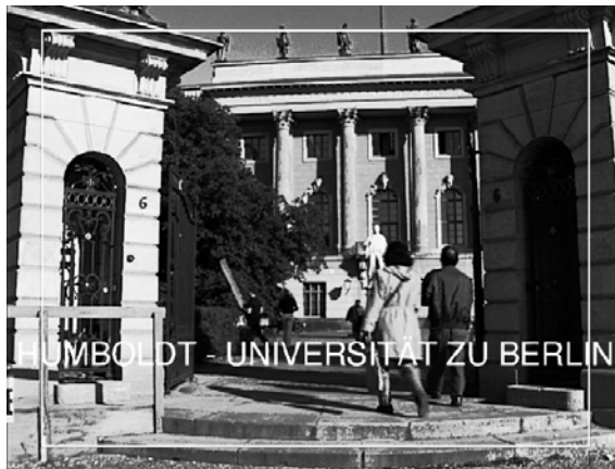
Abb. 4: Action-Area und Text im Film

Einige Zubehörhersteller wie HAMA oder VIVANCO bieten spezielle Geräte an, bei denen Projektor und Kamera wie in einen Tunnel schauen. Die Abstände sind