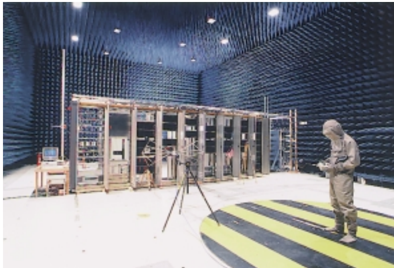
Abb. 1. Tim Rautert: Siemens AG, München, 1989.

Tatsächlich ist die Wahrnehmungswelt des Menschen in ihrer kulturellen Bedeutung seit langem rückläufig. Wahrnehmung verstehe ich als das evolutionäre Sinnesvermögen des Körpers, wodurch dieser zwischen externer Welt und internen Verarbeitungsformen vermittelt. Wahrnehmung ist aber nicht nur Vermittlung; sie ist selbst produktiv, sie hat Ereignischarakter, sie strukturiert und lagert Erfahrungen ab, sie gewinnt also Geschichte, sie versteht Informationen immer mit ‘Gefühlszeichen’, so daß die ‘in die Wahrnehmung fallenden’ Dinge sich in den Tiefengrund einer Person verzweigen: ihre Gefühle, ihre Gedanken und Deutungen, ihre Erfahrungen und Werte. Philosophisch umstritten ist seit Platon jedoch, ob die an Körper und Sinne des Menschen gebundene Wahrnehmung wahrheitsfähig ist, also zuverlässig über Sein und Struktur der Welt informiert. Dem hatte Platon widersprochen. Wahrheit wird in der europäischen Kultur seither identifiziert mit der unsinnlichen, körperlosen Struktur der Welt. Doch sind dies bis zum 17. Jahrhundert philosophische Annahmen ohne empirische Deckung. Nie war bewiesen, daß die leibgebundene Wahrnehmung über die Wahrheit der Welt ‘täuscht’.