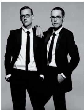
Abbildung 6: Viktor Horsing (rechts) & Rolf Snoeren (links) alias Viktor & Rolf im Jahr 2002

Der nerdy -Look Miucci Pradas, selbst immer im Schullehrerinnen-Look auftretend, könnte für die Amerikanerin Rachel Comey durchaus lehrreich gewesen sein. Die Mode der ehemaligen Galeristin Comey kleidet nicht jede, spricht vor allem die Intellektuellen New Yorks an, Künstler, Musiker, Galerienbesitzer. Shorts mit hohem Bund und aufgesprenkelten Blüten kombiniert mit niedlichen Blusen und Stricktops, geschnitten wie klassische Wifebeater , dazu knielange, schwingende Röcke sowie kurze Jäckchen – alles stets komplettiert durch Brillen mit schweren Gestellen. Und auch für den kommenden Winter bleibt Comey ihrem lässig, charmanten Vintage-Stil treu mit Blusen unter Drei-Viertel-Arm-Pullovern. Und kleine weiße Söckchen, handbedruckt mit Buchtiteln beispielsweise Séance on a Wet Afternoon von Marc McShane, stecken in schwarzen Herrenhalbschuhen.