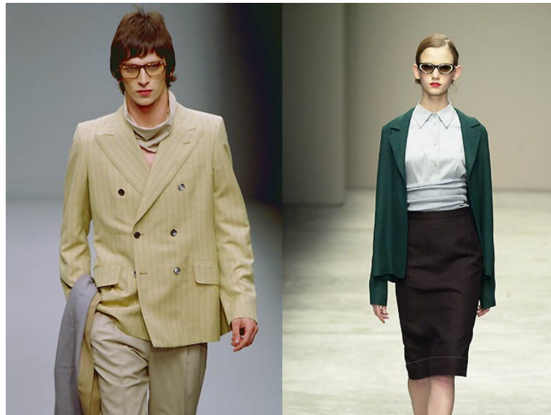
Abbildung 3, 4: Prada Prêt-à-porter Sommer 2001

sellschaftlichen Fortschritt so präzise in Kleidung auszudrücken wie kein anderer Modedesigner. So kann man Pradas Vision als Antagonist zu den mit Sex bestrichenen Kleidchen eines Tom Ford für das Modehaus Gucci verstehen, dem damals jeder hinterher hechelte. Schließlich steckte Prada in genau dieser Saison auch die Männer in extrem taillenhohe, pludrige Bundfaltenhosen im Stil von Hollywoodlegenden der 50er Jahre sowie kastenförmige Doppelreihersakkos mit darunter abstrakt-grafisch gemusterten Hemden, alles in blassem Gelb, Beige und Grau.