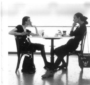
Abbildung 1: Irving Penn „The 1950“

Wie riecht es in einer Bibliothek? Nach einem englischen Roman, russischem und marokkanischem Leder, getragener Kleidung und einer Spur Holzpflegepolitur würde der Parfümeur Christopher Brosius antworten. Das ganze trägt dann den logischen Namen In the Library und ist ein Parfüm, das tatsächlich aufgesprüht werden kann.