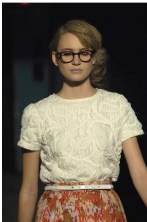
Abbildung 5: Rachel Comey: Prêt-à-porter Sommer 2008

Seitdem kehren nerdige Elemente immer wieder in Pradas Kollektionen auf. 2005 verwandeln Brillen Gesichter in gerahmte Kunstwerke, gekrönt von Wollmützen. Der verpönte und gemeine dicke-Wollsocken-in-Sandalen-zu-kurzen-Hosen-Look sollte dann im Sommer 2007 das gewisse Haben-Müssen-Gefühl auslösen.