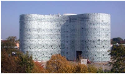
Abbildung 7: Universitätsbibliothek Cottbus, © EGC Cottbus

Kleidung ist ja bekanntlich auch immer ein Spiegel unserer schaft, Architektur und zeitgenössische Kunst ebenso. Früher war die Aufgabe einer Bibliothek hauptsächlich das Bereitstellen ihrer Bücher zum Lesen, und dem Publikum das Lesen zu ermöglichen. Heute ist der Lesesaal der am wenigsten frequentierte Saal. Es fungieren als Lesesäle die Cafeteria im Untergeschoss, wohin man die Bücher mitnehmen darf, wo man an einem Tischchen sitzend mit einem Kaffee und einem Croissant, auch mit einer Zigarette, weiterarbeiten kann.