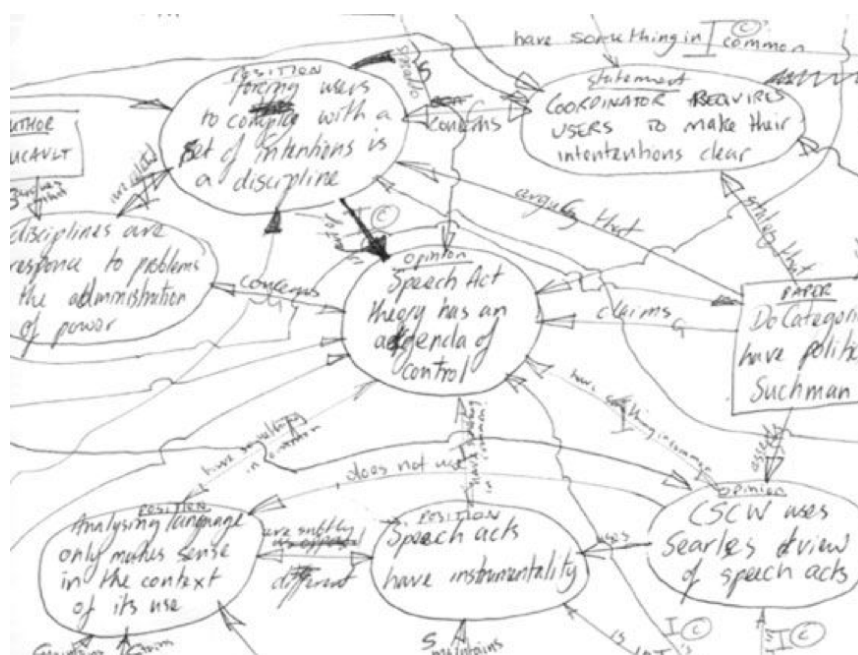
Abbildung 2: Handgezeichnete Skizze der Struktur des semantischen Zusammenhangs des wissenschaftlichen Diskurses in der Forschungsliteratur (aus Buckingham Shum u.a., 2007)

von Dokumenten bereitgestellt werden können und der die Transklusion von Inhalten von Dokumenten zur Nachnutzung (zum Beispiel Zitation) erlaubt. Im Kontext des WWW, deren Hypertext-Konzept die angesprochenen Probleme nicht zu berücksichtigen vermag, äußert sich Ted Nelson in einem anderen Interview wie folgt: „We are using a degenerate form of itv[Hypertext] that has been standardised by people who, I think, do not understand the real problems.“ (Nelson, 2001)