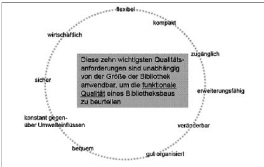
Abb. 1: Die Faulkner-Brownschen Gesetze.

Faulkner-Brown bezeichnet seinen Planungsansatz für Bibliotheksbauten als ‚Offenen Plan‘ ( open plan ), offen für Gestaltungsvarianten und Veränderungen. Diese zehn Regeln, die man auch die „Faulkner-Brownschen Gesetze“ nennt, sind nach Harry Faulkner-Brown unabhängig von der Größe der Bibliothek anwendbar, um die funktionale Qualität eines Bibliotheksbaus zu beurteilen: