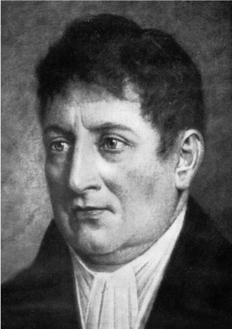
Johann Gottlieb Fichte *19.05.1762 †29.01.1814