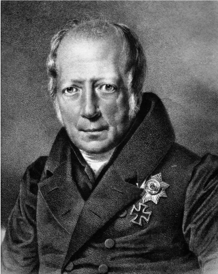
Wilhelm von Humboldt *22.06.1767 †08.04.1835