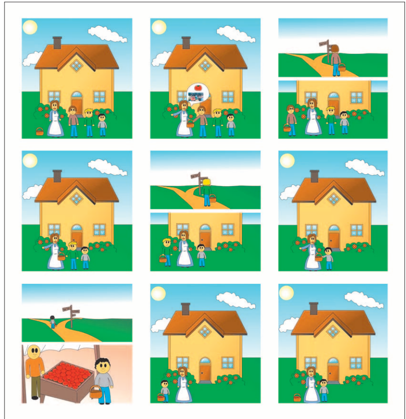
Abb. 3 Aufgabe aus QUIS: Fairy Tale – Topic and Focus in Coherent Discourse (Skopeteas et al. 2006: 149ff.)

Die Menge und Vielfalt der im SFB erhobenen und annotierten Sprachdaten stellt erhebliche Anforderungen an deren Management und Aufbereitung für linguistische Korpusstudien, stammen sie doch aus sehr verschiedenen Sprachen, umfassen elliptische Äußerungen genauso wie komplexe Sätze, Frage-Antwort-Paare, längere Dialoge und schließlich komplette Tex-