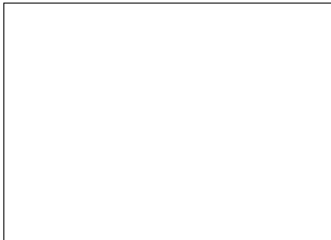
Abb. 3: Der böse Richter Thomasin von Zerclaere: Der Welsche Gast