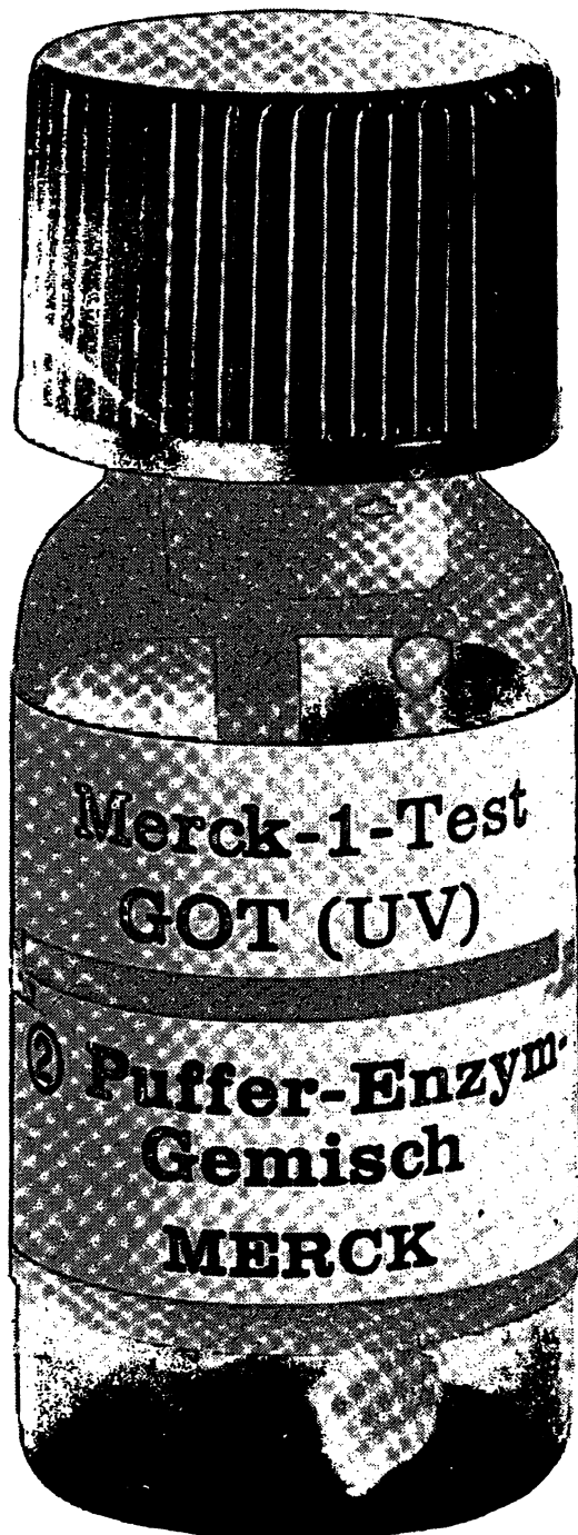
Differenzialdiagnose von Herz- und Lebererkrankungen