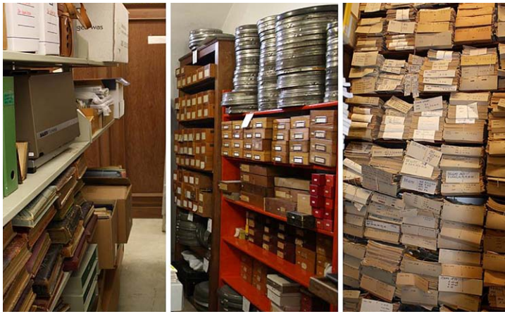
Abb. 1: Teile der Sachkultursammlung, des Bild- und Tonarchivs und der Zeitschriftensammlung im Tübinger Ludwig-Uhland-Institut.

Etikett „Sammelfach“ (JOHLER 2006, 6; KELLER-DRESCHER 2013, 122) mittlerweile wieder ganz bewusst, um Kompetenzfelder abzustecken und durch eine vermeintliche fachhistorische Tradition zu legitimieren. 2 Allmählich werden die heterogenen, aus Zeitschriften, Heftromanen, Fotos, Filmen, Tonbändern, biografischen Aufzeichnungen und vereinzelt auch aus dreidimensionalen Objekten bestehenden volkskundlich-kulturwissenschaftlichen Sammlungen (Abb. 1), die an einzelnen Universitätsinstituten seit den 1930er Jahren, in der Mehrzahl jedoch seit den 1960er Jahren zusammengetragen wurden, aus Kellerräumen, von Dachböden, aus Teeküchen und Kopierräumen hervorgeholt und nach etwaigen Potentialen für die Forschung und Lehre befragt. 3