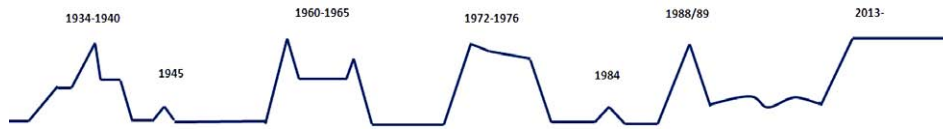
Abb. 3: ‚Collectiogramm‘ der Tübinger Sachkultursammlung. Grafik: Sabine Müller-Brem

Das zweite überlieferte Inventar wurde im April 1960 begonnen, wie aus einer Notiz auf der ersten Seite des Inventarbuches hervorgeht. In dieses Inventar wurden von einer Person – davon zeugt die gleichbleibende Handschrift – zunächst die Sammlungsbestände aus den 1930er Jahren übertragen. Diese wurden anschließend ebenso wie die bis einschließlich 1965 neu hinzugekommenen Objekte in einer DIN-A5-Kartei erfasst. 7 Um 1965 wurden die ‚neuen‘ Objekte dann nachträglich von verschiedenen Personen auch im 1960 begonnenen Inventarbuch eingetragen. Dass dieser Schritt nachträglich erfolgte, ist an der nicht dem Anschaffungszeitpunkt entsprechenden Reihenfolge der Objekteintragung zu erkennen. 1965 bricht die in den beiden überlieferten Inventaren sichtbare Sammlungsaktivität – wie zuvor 1945 – schließlich abrupt ab.