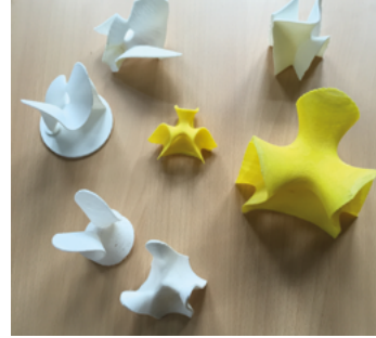
Abb. 5: Digitales Bild des eingescannten Exponats. Abb. 6: 3D-Druck von Reproduktionen und Variationen von Flächen dritter Ordnung.