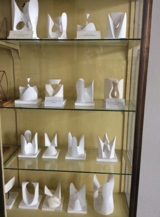
Abb. 4: Schrank in der Göttinger Sammlung mit Gipsmodellen zu Flächen dritter Ordnung.