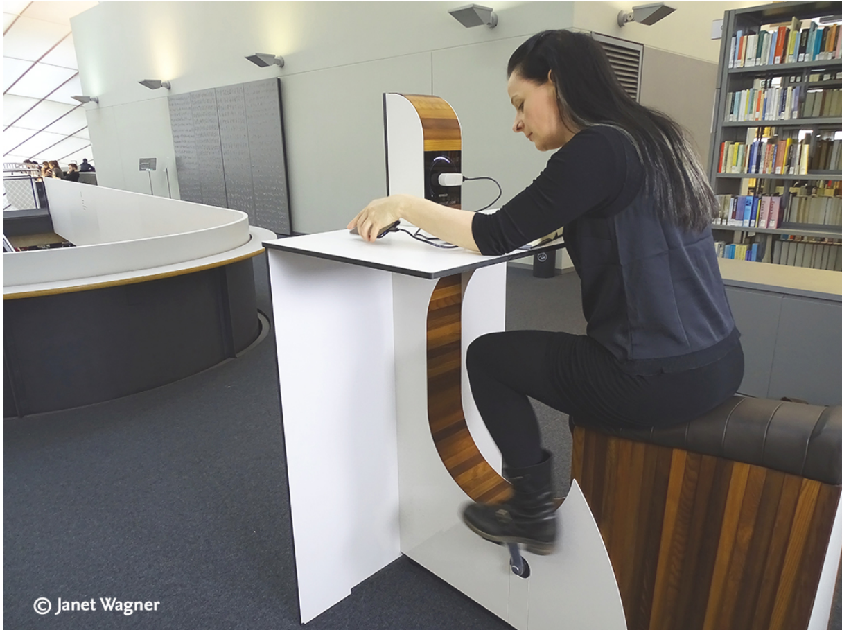
Abb. 2: Stromerzeugendes Lesefahrrad