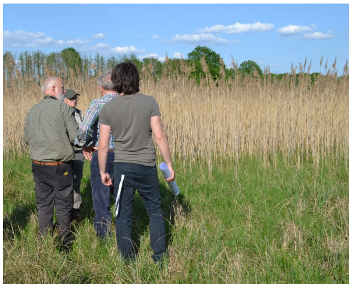
Abbildung 2: Besichtigung der Feuchtwiesen im Spreewald

Im Biosphärenreservat Spreewald sollen wertvolle Feuchtwiesen vor der Nutzungsaufgabe geschützt werden, indem innovative Ideen, wie ‚Entwicklungspflegepools‘ und ‚Heizanlagen zur Biomasseverwertung‘ lokal implementiert werden. Dafür ist Wissen zur Akzeptanz dieser Ideen (z. B. Akzeptanzfaktoren) wichtig. Deshalb wurden mithilfe des Moduls 1 ‚Akzeptanzanalyse‘ Interviewdaten erhoben und ausgewertet 1 . Ein zweites Anwendungsbeispiel ist die Akzeptanzanalyse zu Zweinutzungshühnern. Das Modul 1 ‚Akzeptanzanalyse‘ wurde genutzt, indem eine quantitative Telefonbefragung (n=1 000) durchgeführt wurde, ob Verbraucher_innen Zweinutzungshühner kennen, wertschätzen und solche Produkte kaufen würden 2 .