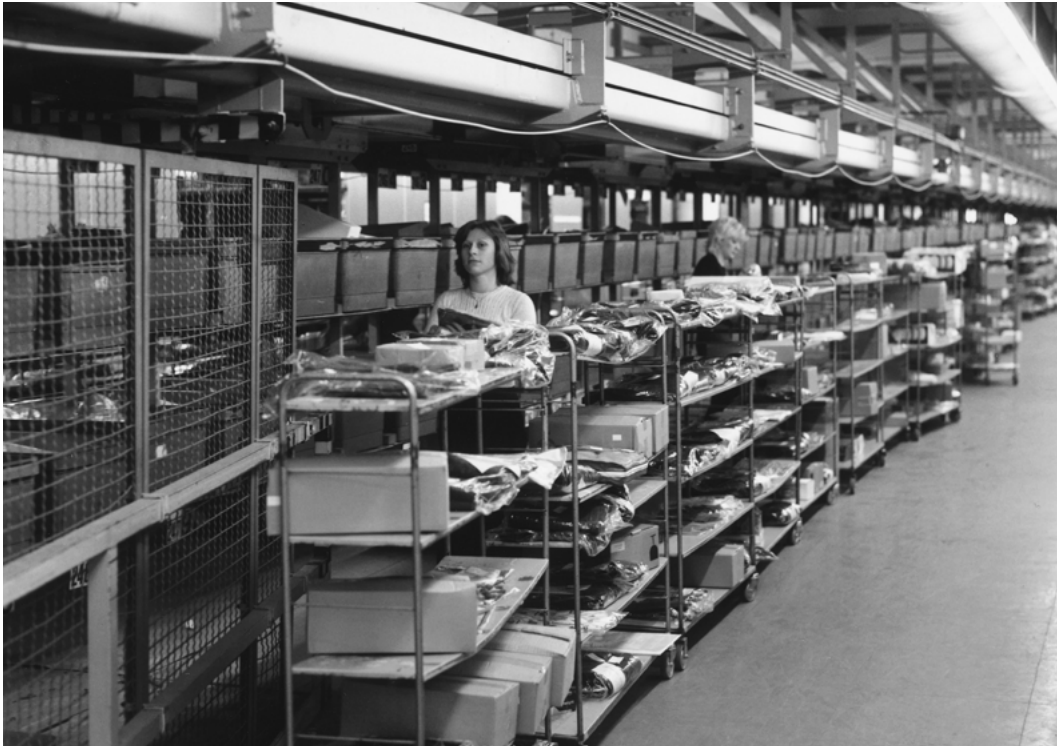
Abb. 2: Logistikerinnen am Hängeförderer – bis zu 2860 Wannens liefen an 286 Gehängen durch das achtstöckige Kommissionierlager. Die Geschwindigkeit variierte nach Bestellaufkommen und gab den Takt vor, in dem die Versandartikel bereitgestellt und in die Wannens geworfen werden mussten.

ren Fokus auf die Automatisierungsprozesse im Arbeitsalltag zeigen sich im Material neue Aspekte im Hinblick auf die »Technizität von Kultur« (Hengartner 2012, 119): Die Technik bildet den konkreten Bezugspunkt für die Reflexion des gesellschaftlichen Wandels.