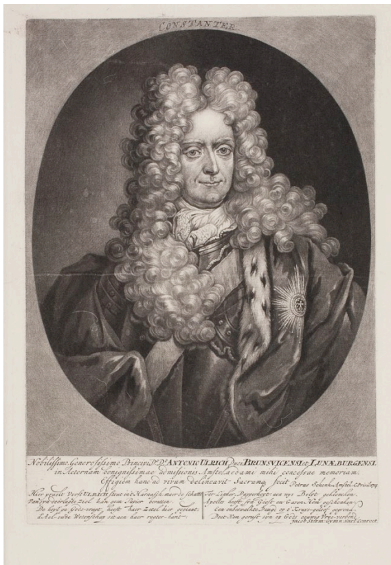
Abb. 2: Widmungsporträt Anton Ulrichs in Pieter Schenks „Roma Aeterna“ (1705).