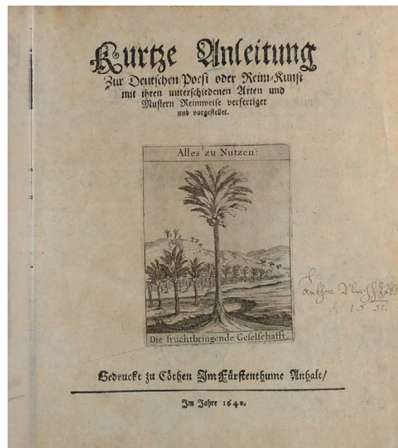
Abb. 1: Herzog Anton Ulrichs handschriftlicher Eintrag auf dem Titelblatt „Anton Ulrich HZBVL 1652“ der „Kurtze[n] Anleitung zur Deutschen Poesi oder Reim-Kunst“ (1640). Wolfenbüttel, Herzog August Bibliothek Wolfenbüttel, M: Ud 172, http://diglib.hab.de/drucke/um-40/start.htm?image=00005 (15.1.2020). Lizenz: CC BY-SA

Die häufigsten Spuren in Büchern sind Provenienzmerkmale, die persönlichen Buchbesitz markieren. Dazu zählen neben handschriftlichen Einträgen vor allem Exlibris, aber auch