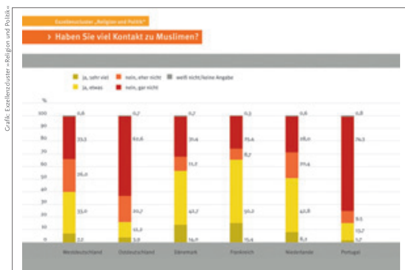
Abb. 4

Mittels qualitativer Untersuchungsmethoden soll erforscht werden, ob Menschen mit muslimischem Migrationshintergrund in Deutschland und Europa als Träger hybrider Identitätsmuster dazu beitragen können, die Wandelbarkeit von nationalen und kulturellen Identitäten zu dokumentieren und ob deren Potential zur Mediation genutzt werden kann, um interkulturelle Alltagskompetenz zu etablieren und Identität als gesellschaftspolitische Konfliktkategorie, die sie zweifelsohne für die Politikwissenschaft seit Huntington ist, zu entschärfen. Hierzu werden 50 qualitative, leitfadengestützte, problemzentrierte Interviews geführt und im Hinblick auf die Fragekomplexe Zugehörigkeit, Selbstwahrnehmung, Fremdwahrnehmung, Mobilität und Hybridität codiert und ausgewertet. Aus den codierten