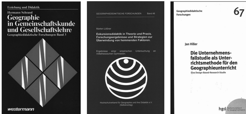
Abb 3 Layout der Geographiedidaktischen Forschungen 1977 bis 2017

Viele Bibliotheken an geographiedidaktischen Universitätsstandorten beziehen die Buchreihe im Abonnement, so dass die Verfügbarkeit der Bände der Reihe oftmals durchgängig gegeben ist. Darüber hinaus zählen Einzelpersonen zu den Abonnenten der Buchreihe. Einzelne Bestellungen über ein Abonnement hinaus wurden bis 2013 über die Schriftleitung abgewickelt, bei der die Bestellungen der Bände der im Selbstverlag des HGD erscheinenden Buchreihe direkt oder vermittelt über den Buchhandel aufliefen. Mit dem Wechsel zu einem Verlag im Jahre 2013 änderten sich auch die Bezugsoptionen: Als gedruckte Exemplare sind die Bände – abgesehen von Abonnements – ausschließlich über den Buchhandel zu beziehen. Zugleich erfolgte eine weitere grundlegende Veränderung: Die neu erschienenen Bände sind zusätzlich zu den Druckexemplaren auf dem ebenfalls 2013 neu erstellten Internetauftritt der Schriftenreihe (vgl. Abb 4,) als PDF kostenfrei verfügbar, allerdings im Vergleich zum Erscheinen der Druckexemplare mit einer Zeitverzögerung von vier Monaten. Zudem