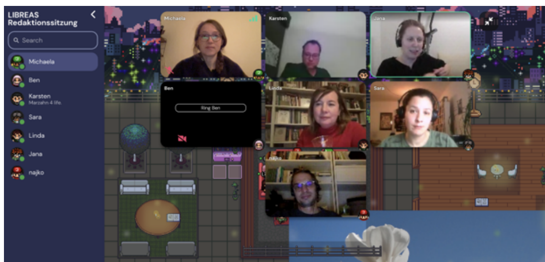
Abbildung 2: Redaktionsorte – immer noch online