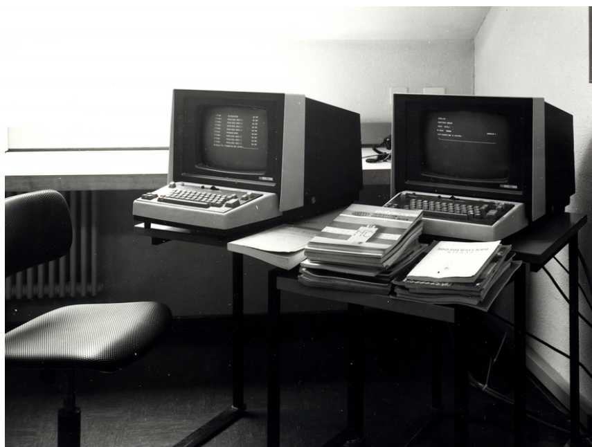
Abbildung 1: „Zürich, ETH Zürich, Hauptgebäude (HG), Hauptbibliothek, Zeitschriftenabteilung“, laut Metadaten 1968, eher frühe 1970er Jahre. Terminale, die an einen Grossrechner angeschlossen waren, genutzt für die Katalogisierung.

dieser Entwicklungen geschildert: Warum machten sich Bibliotheken darum Gedanken, wie sie ihre Arbeit rationeller organisieren konnten? Warum richteten sie ihren Blick dabei auf Maschinen? Daran anschliessend werden die Themen diskutiert, auf die sich dabei die Beiträge und praktischen Versuche von Bibliotheken richteten (3). Hier wird sich zeigen, dass nicht die gesamte Bibliothek oder die Nutzer*innen im Fokus standen, sondern immer wieder über einzelne, abgrenzbare Funktionsbereiche der bibliothekarischen Arbeit nachgedacht wurde. Abschliessend wird auf das Fehlen von Kritiken und Utopien (4) im Zusammenhang mit der Einführung von Computern eingegangen, welches – angesichts anderer Veränderungen und Utopien, die sich zumindest in der bundesdeutschen, schweizerischen und österreichischen Gesellschaft zu dieser Zeit virulent waren – erstaunt. Auch wenn der DACH-Raum in diesem Beitrag gemeinsam behandelt wird, wird in einem kurzen Kapitel auf die Unterschiede zwischen zwei Ländern, der DDR und der BRD, eingegangen (5). Hier zeigt sich am Beispiel der Einführung von Computern, dass, trotz gegenseitiger Einflüsse, die Entwicklung der Bibliothekswesen jeweils länderspezifische Eigenheiten hatte. Zuletzt wird im Fazit diskutiert, welche Bedeutung diese Geschichte für heutige Bibliotheken hat. (6)