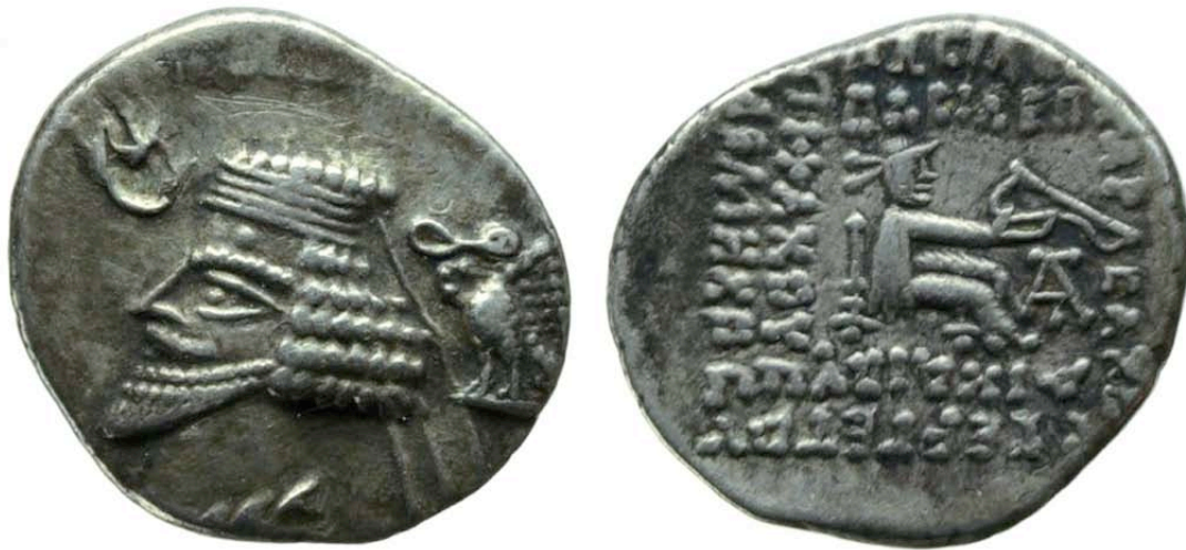
Abb. 6: Silberdrachme des Phraates IV.

eine Münze seines Vater Phraates IV. (Abb. 6). 23 Die Vorderseite zeigt das Porträt des Phraates IV. nach links sowie Stern und Mondsichel (links) und Adler mit Kranz (rechts). Die Rückseite ist jedoch bei der Musa-Münze völlig anders gestaltet. Parthische Münzen zeigen in der Regel einen sitzenden Bogenschützen zwischen einer quadratisch umlaufenden Inschrift aus griechischen Buchstaben (so auch Abb. 6). Dieses Kompositionsschema geht auf griechisch-hellenistische Münztypen zurück, die von den Parthern übernommen und in eine spezifische Formensprache transformiert wurden. 24