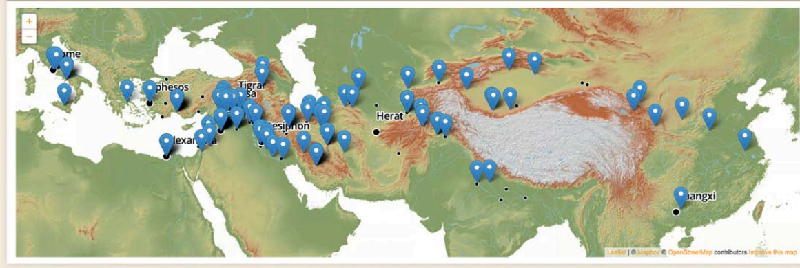
Abb. 3: Die interaktive Karte der Ausstellung. Die blauen Pins können angewählt werden und sind mit den Beschreibungstexten verlinkt. Die Basiskarte wurde mithilfe von Dr. Carsten Mischka in einer Arbeitsgruppe mit Studierenden des IHAC erstellt.

Browse All Browse by Tag Search Items Browse Map