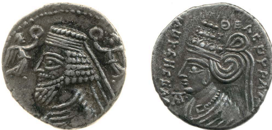
Abb. 5: Silberdrachme des Phraatakes mit Porträt der Musa auf der Rückseite. British Museum, 1894,0506.2347

Status, da sie als Sklavin nach Parthien gelangte. Ob die parthische Gesellschaft diese Ansicht teilte, muss aufgrund fehlender literarischer Quellen offenbleiben. Zumindest scheint es nach Flavius Josephus nicht der kometenhafte Aufstieg der Musa gewesen zu sein, der die parthischen Adligen erzürnte, sondern erst das Mordkomplott und die Blutschande. Andererseits könnte dies auch als Kritik an den Parthern zu lesen sein, welche die Herrschaft einer Frau, die dazu nicht standesgemäßer Herkunft war, ohne Widerstand akzeptierten.