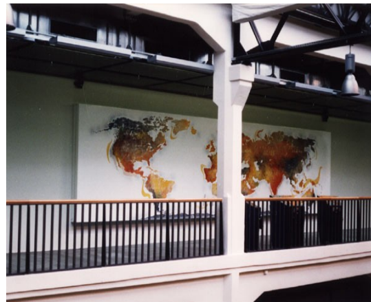
Thomas Gerwin, KlangWeltKarte , ZKM Karlsruhe.

Ausgangsmaterial für die Soundfiles sind ausschließlich originale Umweltklänge, die im Computer verarbeitet wurden. Die musikalische Gestaltung der einzelnen Soundfiles bestimmt dann den Veränderungsgrad, der vom reinen Tonschnitt zur Erzeugung einer naturalistisch anmutenden Tonszene bis hin zu extremen Verfremdungen durch dichte Überlagerungen, Filtern, Reverse, Time-Stretching, etc. gehen kann. Jeder Soundfile beschreibt eine eigene, unverwechselbare Klangfigur, die sich kontrapunktisch zu einer bzw. mehrere der anderen in eine musikalische Beziehung setzen lässt. Man kann also einen Soundfile singulär und ganz anhören oder auch mehrere gleichzeitig und zeitlich versetzt abspielen. Die einzelnen Soundfiles sind digital gespeichert und über einen speziell programmierten Sampler abspielbar.