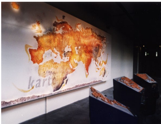
Thomas Gerwin, KlangWeltKarte , ZKM Karlsruhe.

Wir sind ständig umgeben von den Klängen, Rhythmen und Melodien des Alltags, mehr als das, wir produzieren sie mit. Die akustische Umwelt differenziert, gar musikalisch wahrzunehmen, liegt dabei zuerst bei uns selbst und unserer auditiven Sensibilität. Diese spielerisch zu nutzen und dabei lustvoll weiterzuentwickeln, ist ein Hauptziel der KlangWeltKarte . Wir leben in einer Symphonie – und gestalten sie durch unser Tun mit, zum Positiven oder Negativen.