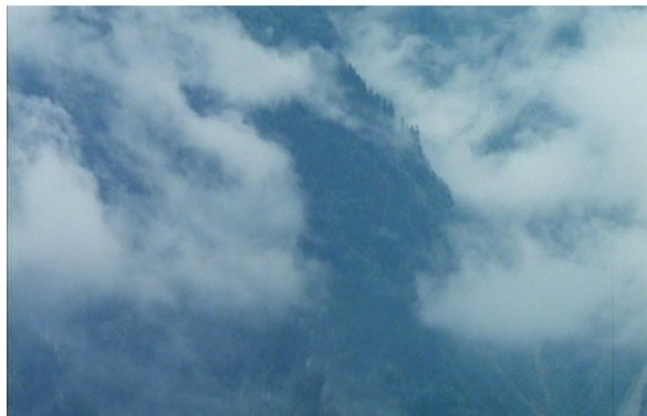
(Abb. 1) HÖHENFEUER: Wolken- und Nebelbild

In HÖHENFEUER sind es vor allem Wolken- und Nebelbilder, die die narrativen Bilder gerinnen und ins Leere laufen lassen (Abb. 1). Jene lassen nicht nur das Bergpanorama in den Hintergrund treten oder ganz verschwinden, sondern sie zerlegen auch die stereotype Postkartenidylle der Schweizer Alpen. Kadrierung und Einstellungsgröße werden in diesen Bildern unwichtig, Umriss sind kaum erkennbar und Figuren überwiegend verschwunden. Stattdessen tritt die Oberfläche des Bildes hervor, die sich in weißen, diffusen Fetzen watteartig zusammenballt und vom dunklen Gestein abhebt. In den Wolken- und Nebelbildern mischen sich Luft und Wasser, die die Oberfläche feucht und kalt aufscheinen lassen. Indem die Sonne den Bildern zeitweise eine intensive Helligkeit verleiht, entsteht zugleich eine Empfindung von Wärme. Die Wolken, die stetig weiterziehen, verändern ihre Form und verweisen somit auf die Vergänglichkeit der Zeit.