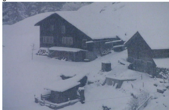
(Abb. 4) HÖHENFEUER: Schnee- und Sturmbild

In einer dritten Kategorie finden sich Regen- und Blitzbilder, die Wasser, Feuer und Erde aufeinander prallen lassen (Abb. 3). Paradoxerweise gräbt sich der Bub, vom Blitz und Donner erschreckt, in die Erde und Berglandschaft ein. Doch existieren in HÖHENFEUER auch zahlreiche Regen- und Blitzbilder, die ohne Figuren auskommen. Auch hier verschiebt sich die Aufmerksamkeit von der Rahmung des Bildes hin zu seiner Textur: nicht mehr die Kadrierung der Leinwand oder die Größenverhältnisse von Dingen und Figuren in Relation zum Handlungsraum, sondern die Oberfläche und Beschaffenheit der Leinwand selbst treten nun in den Vordergrund. Das Bild wird durch das Unwetter als gleichermaßen fluide-verschwommen sowie feucht-kalt (Regen) und rissig-fragmentarisch sowie trocken-heiß (Blitz) wahrgenommen.