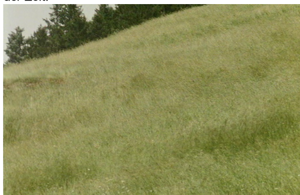
(Abb. 2) HÖHENFEUER: Wind- und Sonnenbild

In HÖHENFEUER sind es vor allem Wolken- und Nebelbilder, die die narrativen Bilder gerinnen und ins Leere laufen lassen (Abb. 1). Jene lassen nicht nur das Bergpanorama in den Hintergrund treten oder ganz verschwinden, sondern sie zerlegen auch die stereotype Postkartenidylle der Schweizer Alpen. Kadrierung und Einstellungsgröße werden in diesen Bildern unwichtig, Umriss sind kaum erkennbar und Figuren überwiegend verschwunden. Stattdessen tritt die Oberfläche des Bildes hervor, die sich in weißen, diffusen Fetzen watteartig zusammenballt und vom dunklen Gestein abhebt. In den Wolken- und Nebelbildern mischen sich Luft und Wasser, die die Oberfläche feucht und kalt aufscheinen lassen. Indem die Sonne den Bildern zeitweise eine intensive Helligkeit verleiht, entsteht zugleich eine Empfindung von Wärme. Die Wolken, die stetig weiterziehen, verändern ihre Form und verweisen somit auf die Vergänglichkeit der Zeit.