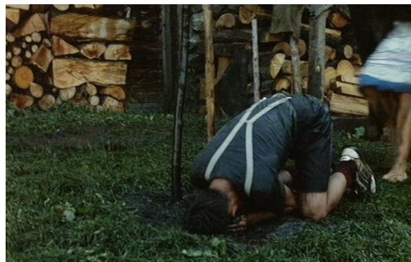
(Abb. 3) HÖHENFEUER: Regen- und Blitzbild

sanften Hin und Her der zartgrünen Wiesen verbinden sich Luft und Erde, die Empfindungen von Wärme und Trockenheit auslösen. Auch hier sind Umriss- oder Figur-Grund-Relationen aufgelöst und ins Haptische überführt, klanglich wie bildlich. Das sanfte Blasen des Windes und die wellenartigen Grasbewegungen werden ebenso hör- wie sichtbar.